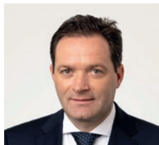
Norbert Totschnig Bundesminister für Land- und Forstwirtschaft, Regionen und Wasserwirtschaft

In Österreich gibt es rund 8.000 bewirtschaftete Almen und Weiden. Sie sind Natur pur, geschätzte Urlaubsziele und wichtige Wirtschaftsräume. Dass das so ist, verdanken wir unseren Bäuerinnen und Bauern. Sie pflegen diese schönen Naturlandschaften und wahren mit dem Almbetrieb von Weidevieh eine jahrhundertalte Tradition. Österreichs Almen und Weiden prägen unsere Kulturlandschaft, stehen für regionale Lebensmittel und natürliche Vielfalt. Sie sind aber auch ein wichtiger Tourismusfaktor.