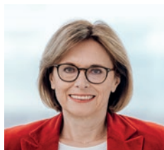
Susanne Kraus-Winkler Staatssekretärin für Tourismus

” Unsere Almen sind beliebte Ausflugs- und Erholungsziele für Gäste aus nah und fern. Sie sind aber vor allem Wirtschaftsraum von Bäuerinnen und Bauern, wie auch Lebensraum für Weidetiere. Um dieses Naturerlebnis zu erhalten, erinnern wir an die zehn einfachen Verhaltensregeln für ein gutes Miteinander auf der Alm und Respekt für die Almwirtschaft. “